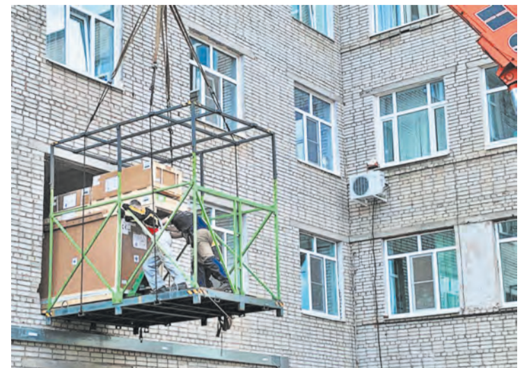
Идёт разгрузка современного медицинского оборудования весом около 6 тонн

В Боровичскую ЦРБ прибыл уникальный дорогостоящий аппарат – ангиограф, позволяющий проводить сложные операции на сердце.