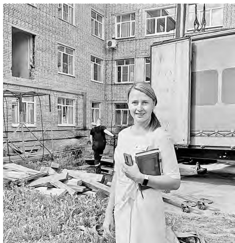
На приёмке нового медицинского оборудования