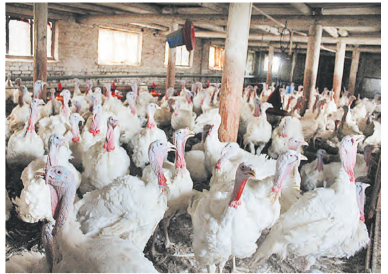
Завидев посторонних, индейки очень волнуются