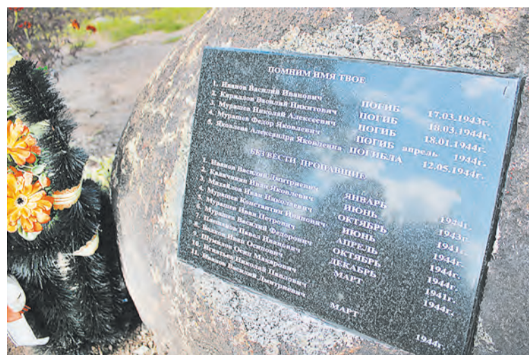
Валун с мемориальной плитой установлен при въезде в деревню