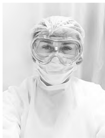
В ковидном отделении

ситуация: среди врачей, санитарок, медицинских сестер был большой процент заражений ковидом. Пришлось быстро выходить на работу. Сейчас ситуация иная, в первую очередь, потому что появилась возможность вакцинации. Пользуясь случаем, призываю всех читателей ответственно подойти к своему здоровью и безопасности окружающих. И, если кто-то еще не привился, сделать это.